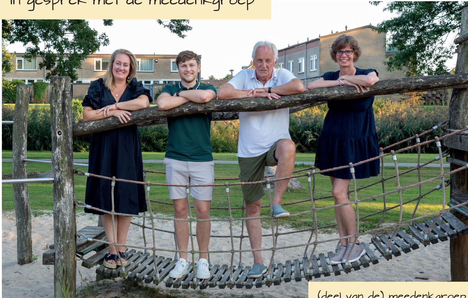
(deel van de) meedenkgroep